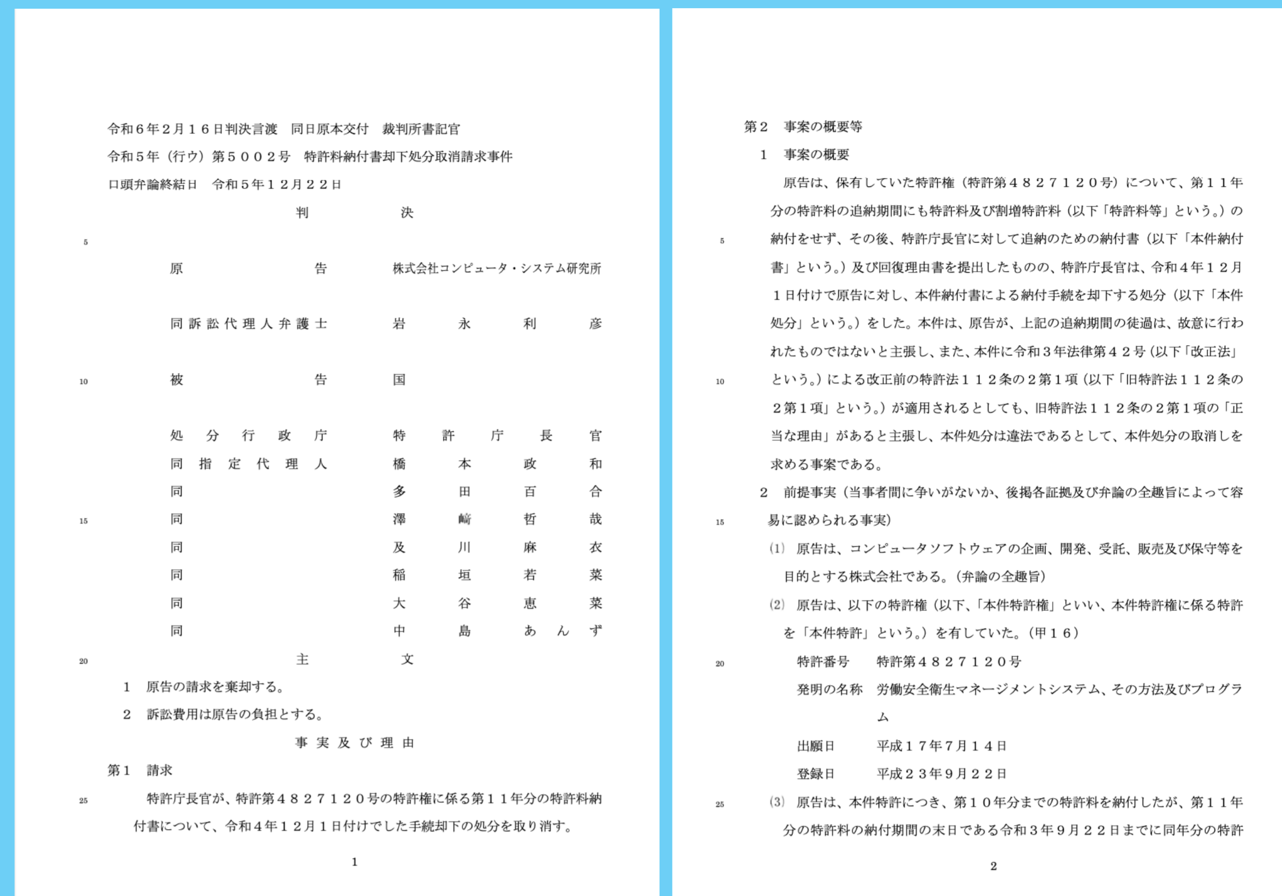
判例PDFの例(ページや行番号などの不要部分、余分な空白がある)