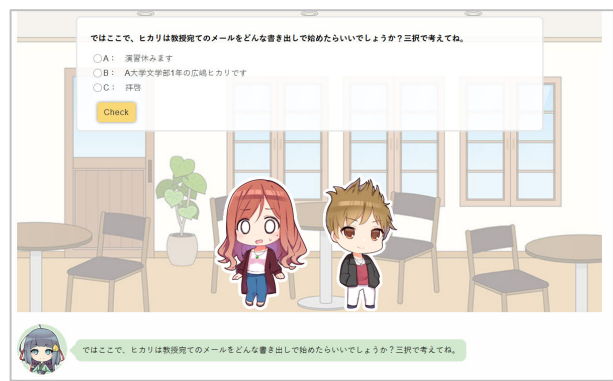
〈図2〉高等教育機関における情報セキュリティ教育のための教材「倫倫姫の情報セキュリティ教室」（2020年3月）

国立大学法人 東北大学 学校法人 法政大学 学校法人 梅村学園 中京大学 学校法人 神戸学院 神戸学院大学 大学共同利用機関法人 情報・システム研究機構 国立情報学研究所